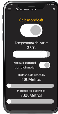
Control por distancia

Distancia de encendido , cuando el telefono este a la distancia minima establecida el calefactor se encenderá automaticamente.