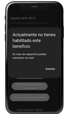
Contáctenos para activarlo