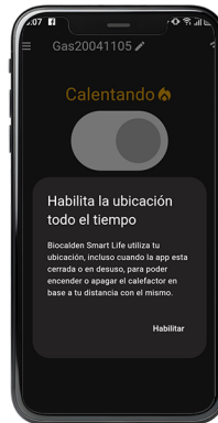
Aclaración sobre Ubicación