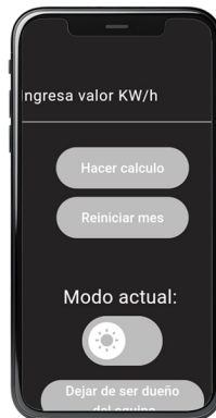
Ingrese el valor que figura en su factura

Si presiona el boton de Reiniciar mes se borran los datos que estaban guardados en memoria, es recomendable usarlo cuando arranca el nuevo ciclo de facturación de su factura de luz para saber con precisión el costo de consumo.