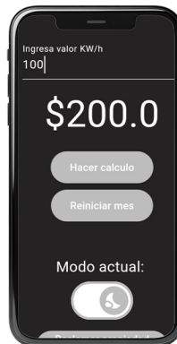
Muestra el gasto en $ del calefactor